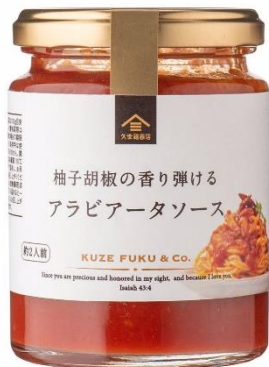
柚子胡椒の香り弾ける アラビアータソース 734 円⇒580 円（税込）