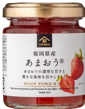
福岡県産 あまおう 625 円⇒500 円（税込）