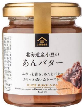
北海道産小豆の あんバター 495 円⇒430 円（税込）