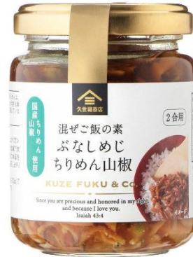
混ぜご飯の素 ぶなしめじちりめん山椒 625 円⇒550 円（税込）