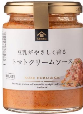
豆乳がやさしく香る トマトクリームソース 734 円⇒580 円（税込）