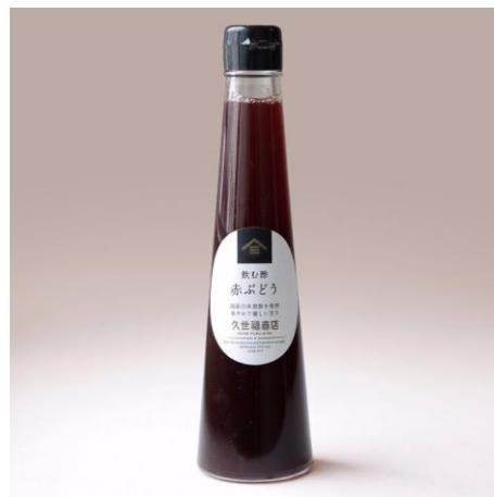
飲む酢 赤ぶどう 614 円⇒500 円（税込）