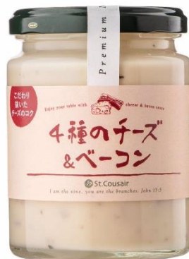
4 種のチーズ&ベーコン 842 円⇒760 円（税込）