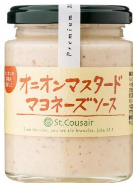
オニオンマスタード マヨネーズソース 646 円⇒498 円（税込）