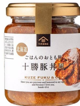
ごはんのおとも旅 十勝豚丼風 646 円⇒550 円（税込）