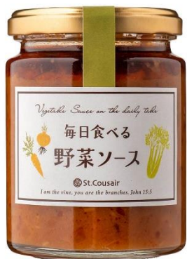
毎日食べる 野菜ソース 711 円⇒598 円（税込）