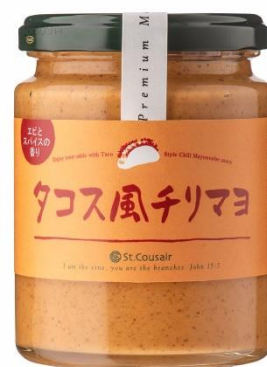
タコス風チリマヨ 711 円⇒598 円（税込）