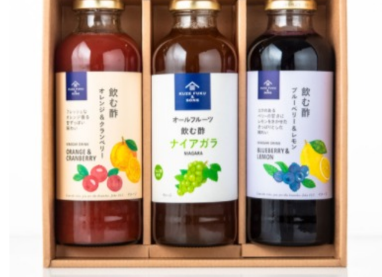
▲さわやか飲む酢3本ギフト：3,240円（税込）

続いてドリンクのギフトのご紹介ですが、こちらはサンクゼールではすっかり夏の定番商品となった「飲む酢」のギフトです。お水や炭酸水、牛乳、豆乳など、いろいろな飲み物で割って人それぞれの楽しみ方ができると、酸味が強すぎず、飲みやすいのがこの飲む酢シリーズの人気秘密。フレッシュな白ぶどうの香りが人気の「ナイアガラ」に加え、期間限定の味「ブルーベリー&レモン」と「オレンジ&クランベリー」を加えたセットは、この夏だけの特別なギフトです。お酒と合わせてカクテルにもできるので、お酒が好きな方や、忙しい方への贈り物としてもおすすめです。