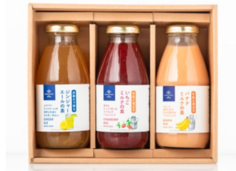
▲果実たっぷりドリンクベース3本ギフト：2,980円（税込）

この夏いちおしなのが、こちらのドリンクベースのセットです。入荷待ちになるほどの大人気商品「牛乳と混ぜる いちごミルクの素」は、たっぷりのいちごと、お砂糖・バニラビーンズのシンプルな材料で作りました。とろりと濃厚・甘酸っぱくて懐かしい！一度飲んだらリピート必至のお味です。姉妹商品の「牛乳と混ぜるバナナミルクの素」のバナナの果実含有率はなんと55%！濃厚でありながらも、後味はさっぱり。バナナをたっぷり味わえるので、お子さまのおやつとしてもおすすめです。そして「炭酸水で割る ジンジャーエールの素」は、刻み生姜とグレープフルーツピールを使用し、ほんのり苦みをきかせた大人の味わい。テレワークの合間のリフレッシュにも嬉しいですね。冷たいドリンクでおうちカフェを楽しんでもらえる、暑い夏にぴったりの贈り物です。