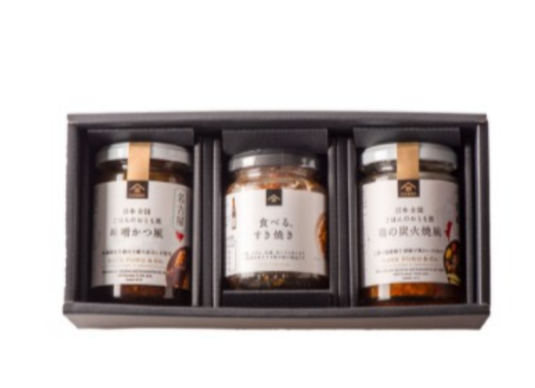
▲人気の食べる、すき焼きとごはんのおとも旅ギフト：2,680円（税込）

久世福商店ロングセラー商品の「食べる、すき焼き」と、日本全国ごはんのおとも旅シリーズを詰め合わせたセットです。この日本全国ごはんのおとも旅シリーズは、「地方の肉料理」をテーマに、お肉の代わりに大豆ミートを使って具材感たっぷりに仕上げたお惣菜です。宮崎県の郷土料理をイメージし、青と赤、2つの柚子胡椒を味の決め手にした「鶏の炭火焼き風」と、名古屋名物の味噌かつをイメージし、老舗味噌蔵の赤だしを贅沢に使用した「味噌かつ風」の2商品をセットにしました。旅行好きなあの人に、ほんの少しの旅気分を贈ってはいかがでしょうか？