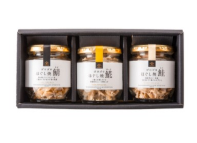
▲贅沢ゴロゴロほぐし食べ比べギフト：2,980円（税込）

ふっくら焼き上げたお魚の身を、ゴロゴロと大ぶりにほぐした人気のゴロゴロほぐしシリーズを食べ比べセットにしました。ほっけ・鮭・鯖の3種は、それぞれのお魚が持つ旨味や脂の甘みを口いっぱいに感じられ、自分で魚の切り身を焼いて食べるよりもおいしいとの声もあるほどです。炊きたてほかほかのご飯にのせて頬張れば、それだけでごちそうに。「どれを食べる？」とご家族での会話も盛り上がりそうです。ほぐし身なので、骨取りの手間が無く、そのままおにぎりにできるのも嬉しいですね。（魚介類加工品のために稀に小骨が混入している場合がございますので、ご注意ください。）