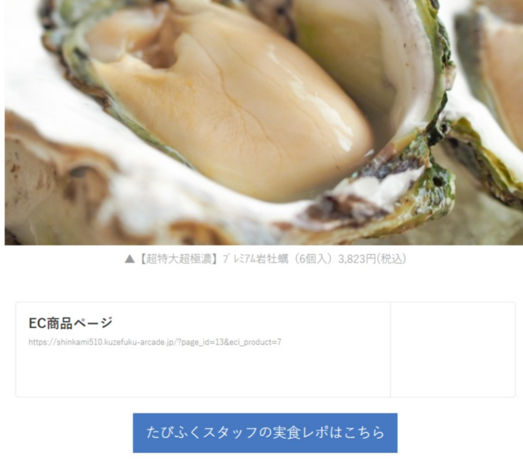
▲【超特大超極濃】プレミアム岩牡蠣 (6個入) 3,823円(税込)

夏に向かってどんどんクリーミーな味わいになるこの時期の岩牡蠣。新上五島町の美しい海で大切に育てられた岩牡蠣のうち、300g以上の特大サイズをお届けいたします。噛んだ瞬間に、クリーミーな味わいがふわっと口の中いっぱい広がる岩牡蠣は、生もよし、焼いてもよし、蒸してもよし…たっぷり堪能していただけます。殻剥き用の軍手・ナイフ・説明書も入っているので初めての方にも安心。殻を剥くところから楽しめる、体験も一緒に贈ることができる一品です。