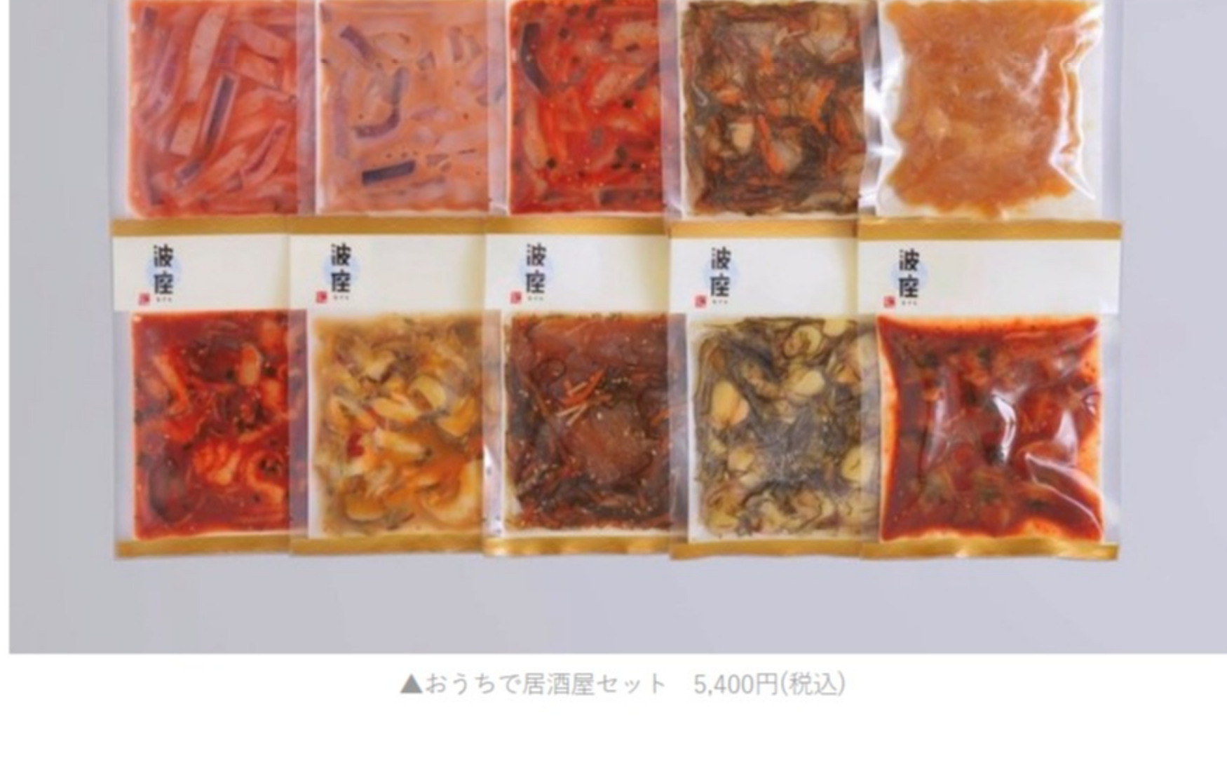
▲おうちで居酒屋セット 5,400円(税込)

いか、ホタテ、貝で作ったおつまみが豪華に10品も入った詰め合わせ。中でもおすすめなのは、「贅沢太切りいか塩辛」。12mm幅という太切りのいかが、プリプリ食感を存分に楽しめる、と大好評です。ほんのり甘口の浅漬けタイプの塩辛なので、辛口のあっさりした日本酒やビールはもちろんのこと、クリームチーズとオリーブオイルを少し加えれば白ワインとの相性も抜群です。冷凍庫から出して解凍するだけで食べられる、という手軽さも嬉しいポイント。10種のうち、1種は何が届くかお楽しみ！毎日1品ずつ楽しむもよし、一度に3種、5種と楽しむもよし。送料込みなので、お父さんと離れて暮らす方にもおすすめです。おうちの最高の晩酌タイムをプレゼントしましょう。