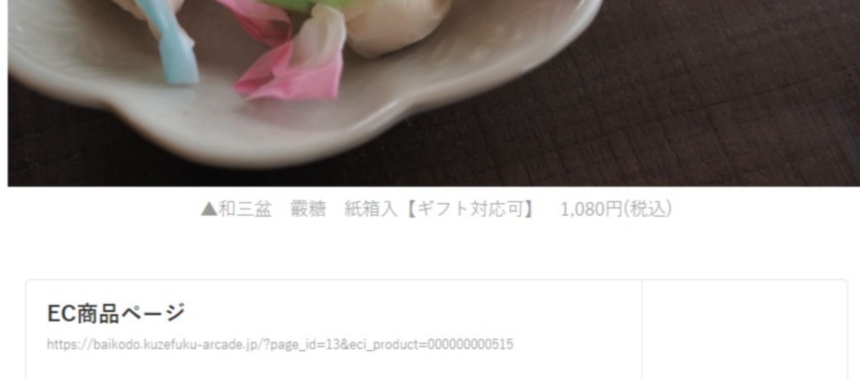
▲和三盆 靨糖 紙箱入【ギフト対応可】 1,080円(税込)

いつも家族のために忙しく働くお父さんには、ほっとできる甘いものをプレゼントするのもいいかもしれません。こちらは香川県のさとうきびを使って、丁寧に作られた和三盆糖でできた干菓子。口の中に入れると、ゆっくりと、でもほぐれるように、舌の上で溶けていきます。飴をなめるようにコロコロ転がす必要はなく、口の中で球体が崩れていく感覚をひたすら感じている時間は、ほんの少しの間、忙しさを忘れさせてくれます。お茶を片手に、普段より少しだけのんびりお父さんとお話をすれば、きっと喜んでもらえるはず。