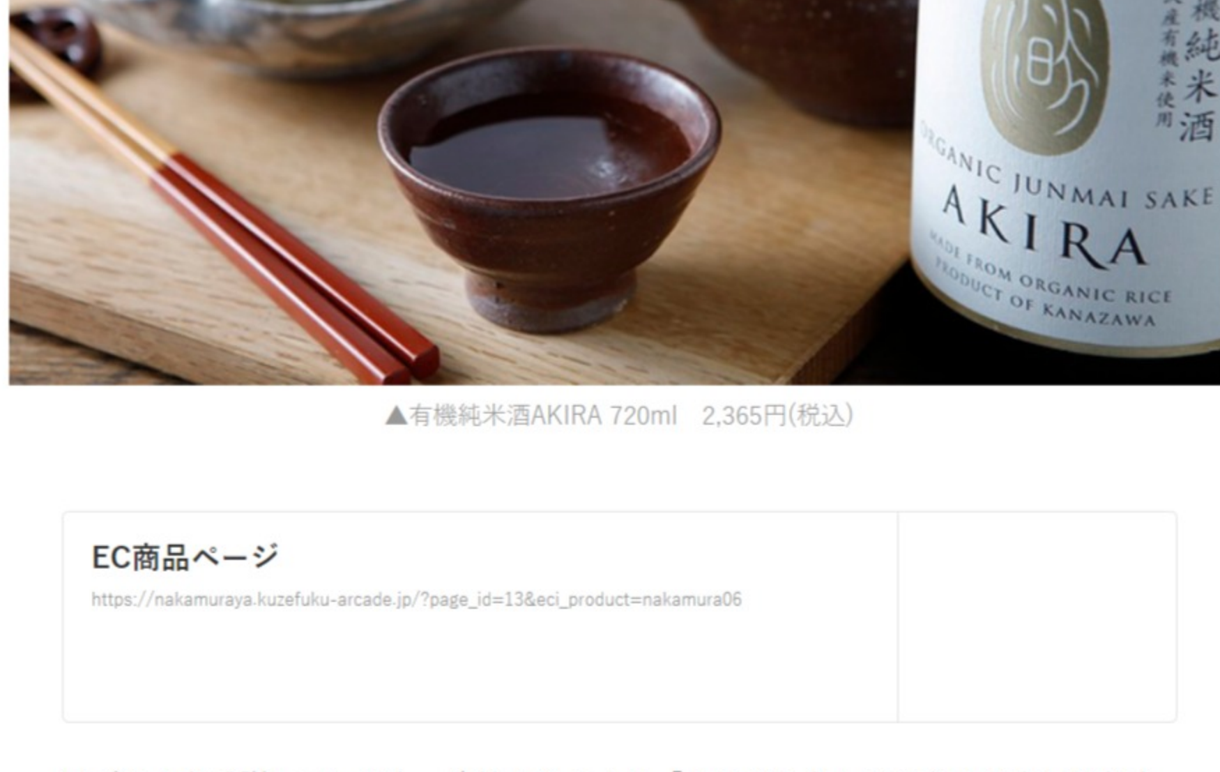
▲有機純米酒AKIRA 720ml 2,365円(税込)

金沢市の有機農場と酒蔵がお届けする、貴重な有機米を使用したオーガニックの日本酒です。有機米の特性を活かしてお米の旨味を十分に感じられるように仕上げつつも、酸度が高くなるように発酵を管理することですっきりとした後味に。強い旨味と、ワイン並みの高酸度で、幅広いお料理に合う食中酒としてお楽しみいただけます。リモートでもリアルでも、お父さんと杯を一緒に傾けながら楽しいひと時を過ごせば、きっと最高のプレゼントですね。