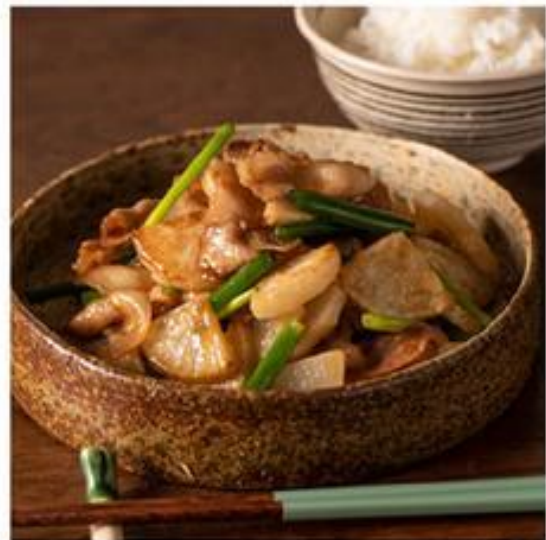
鶏と根菜の黒酢あんのたれ（写真左上）・キャベツと豚肉のふんわり卵炒めのたれ（写真右上）・なすと鶏肉の南蛮炒めのたれ（写真左下）・豚バラ焼大根のたれ（写真右下）

おうちで食事をする機会が増えた分、毎日の料理に悩むことも多くなりましたよね。「今晚のおかず、どうしよう…。」そんな時に役に立つのが、こちらの調味だれシリーズです。ラインナップは「鶏と根菜の黒酢あんのたれ」「キャベツと豚肉のふんわり卵炒めのたれ」「なすと鶏肉の南蛮炒めのたれ」「豚バラ焼大根のたれ」の4つ。食卓のメインになるおかずを時短