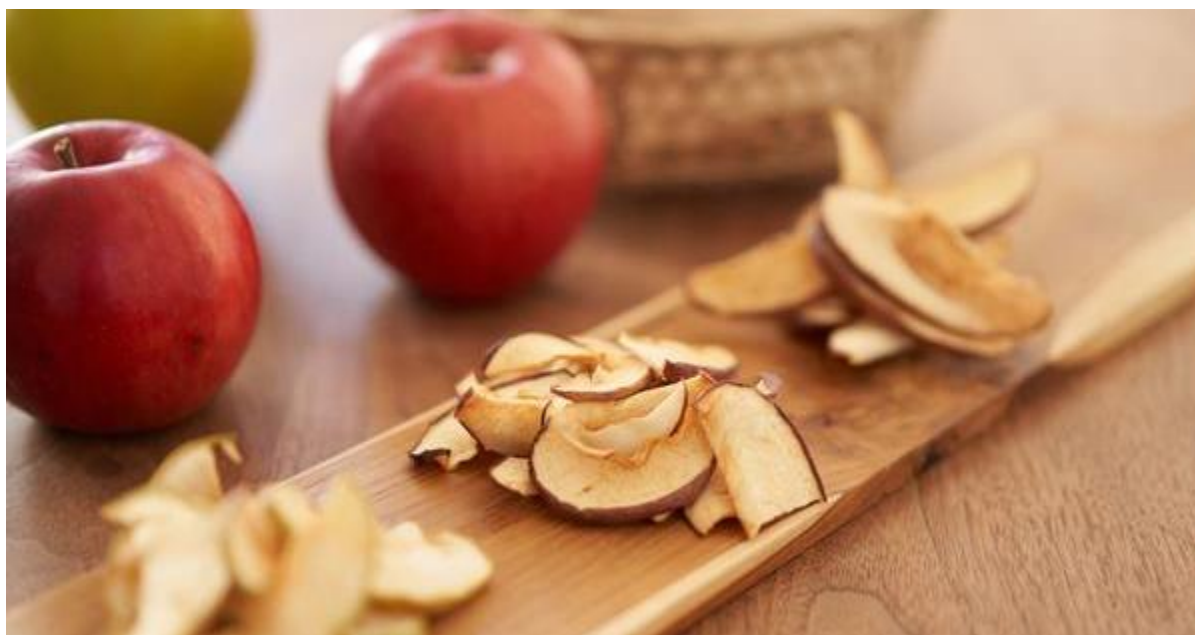
りんごドライ 各種 540円(税込)

減農薬で育てられたりんごを丸ごと1個分干しりんごにしました。袋を開けた瞬間にふわっと広がる、りんごの爽やかで甘い香り。砂糖不使用で、りんごのおいしさがぎゅっと凝縮され、りんごそれぞれの味わいが噛みしめるほどに広がります。