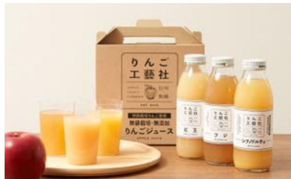
りんごジュース3本セット 2,160円(税込) ※箱代216円(税込)含む

グラニースミス： https://stcousair.jp/SHOP/sh07318.html