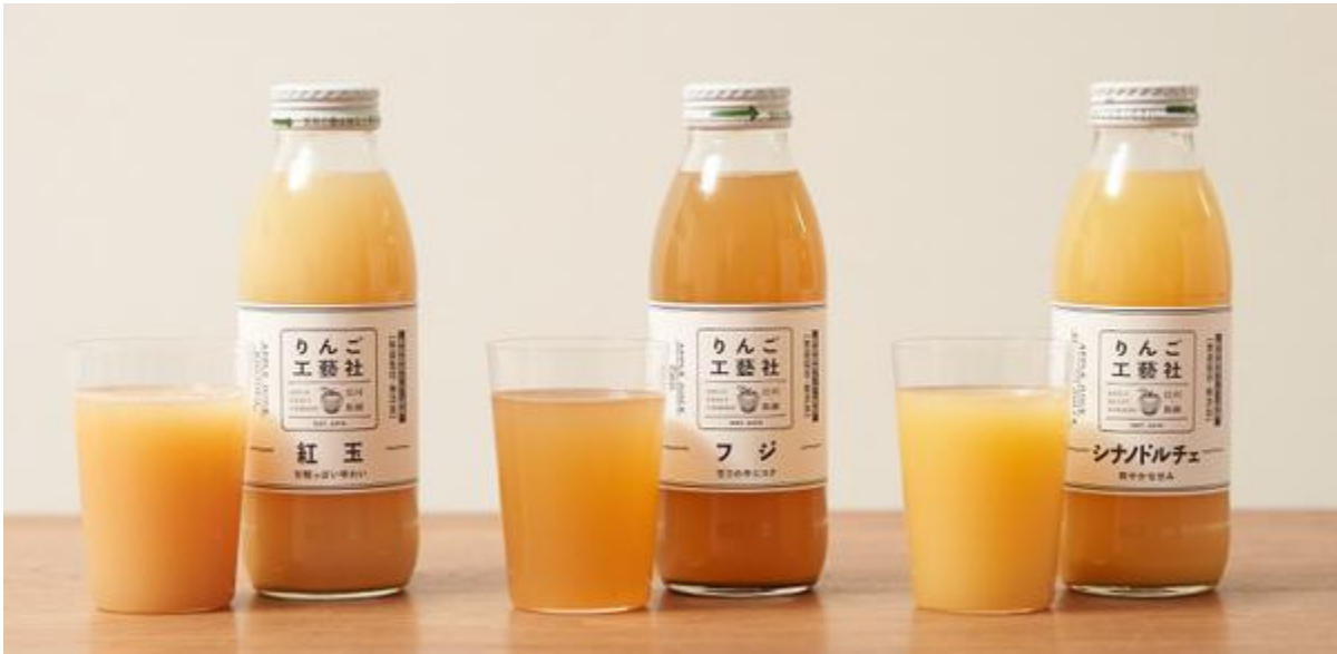
りんごジュース 各種 648円(税込)

安心して皮ごと丸かじりできる特別栽培のりんごを約2個分しぼってつくりました。糖度や酸度の調整を一切していない、添加物不使用のストレート果汁は、まるでりんごを食べているかのようなフレッシュさ！